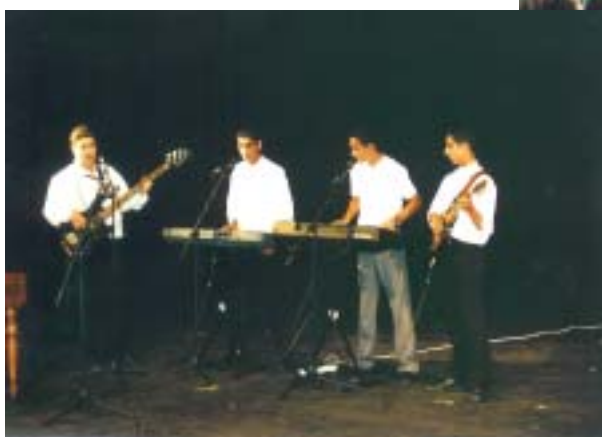
Taneční soubor JEKHETANE a hudební skupina GIPSY SEDAN