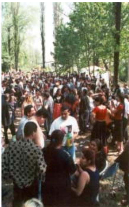
Taneční soubor JEKHE TANE